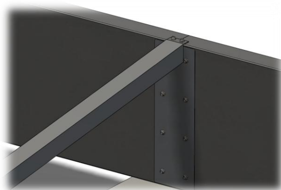
Piastra di collegamento longitudinale dei telai tirante/puntone

Lamilux si riserva di modificare il disegno riportato senza alcun avviso.